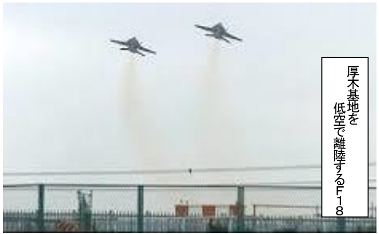
厚木基地を 低空で離陸するF-18